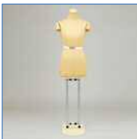
とーりセット (ボディと土台)